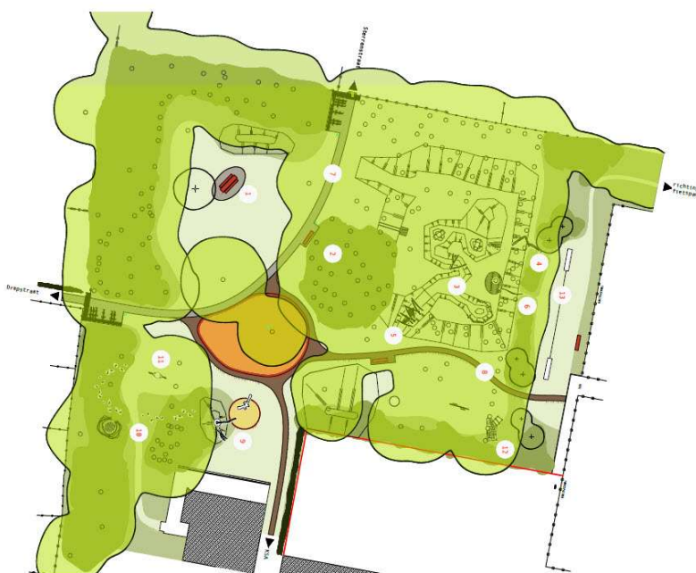
Ontwerp speelzone Sterrenbossite